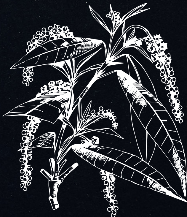
" Croton Zambesicus Müll. Arg. Female shoot"

Très prisées dans le monde botanique, ces graines sont plébiscitées en jardinerie pour son ornement et ses arômes.